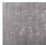
10 DIBBETS TAPPETO CM 300X300